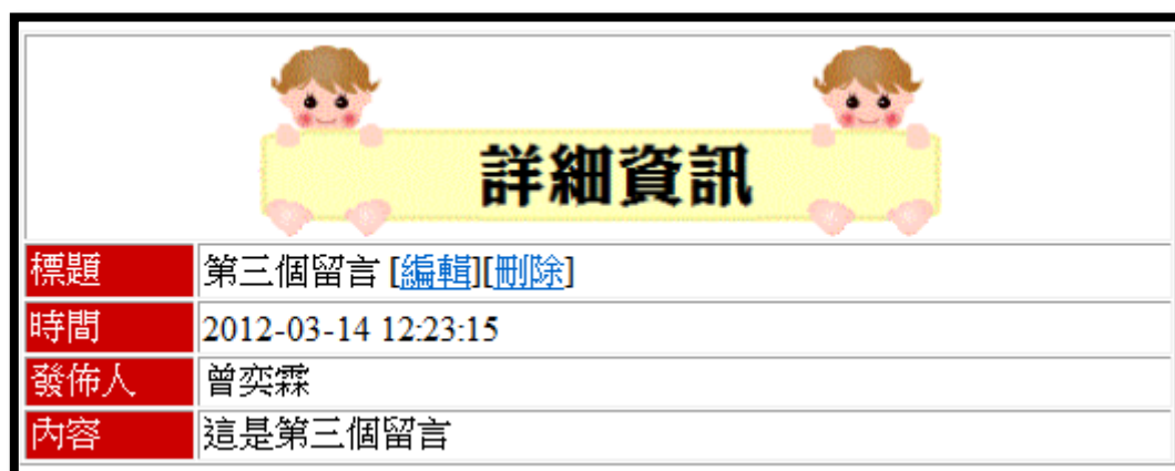
圖 6 從詳細資料可連結到刪除的頁面