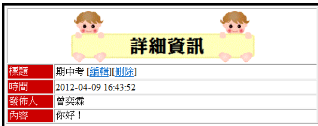
圖 4 若無 url 則不顯示