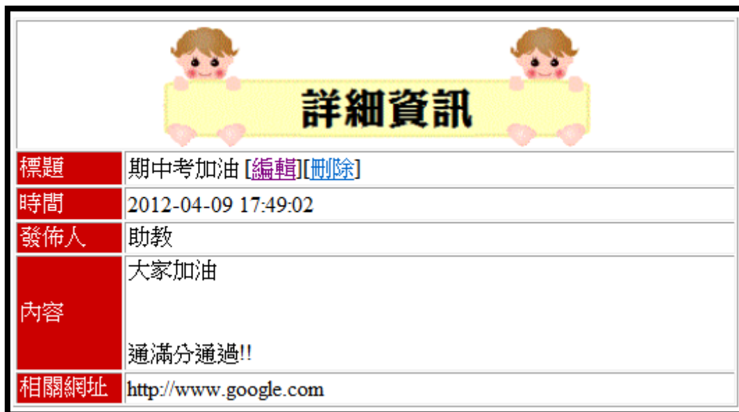
圖 3 多行顯示